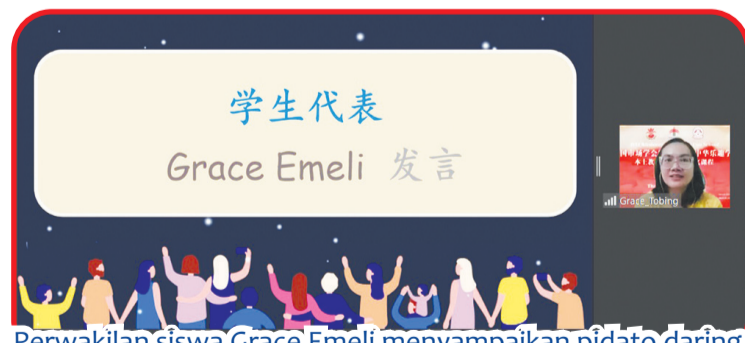
Perwakilan siswa Grace Emeli menyampaikan pidato daring.

mereka sendiri. Semua guru terbaik memberikan pelatihan yang luar biasa dari satu program ke program lainnya. Melaksanakan program dengan cara yang bumi-secara sekaligus melayani mitra dalam dan luar negeri dengan baik adalah misi ICA untuk menyebarkan budaya Tionghoa. Ini juga merupakan kegigihan Hanhua Bowen dalam penanaman pendidikan bahasa Tionghoa internasional selama 15 tahun. Di masa mendatang, guru bahasa Mandarin internasional Hanhua Bowen dan ICA akan menghadirkan hal-hal yang lebih menarik. Maka bergabung, berpartisipasi, dan saksikan bersama-sama. • idn/din