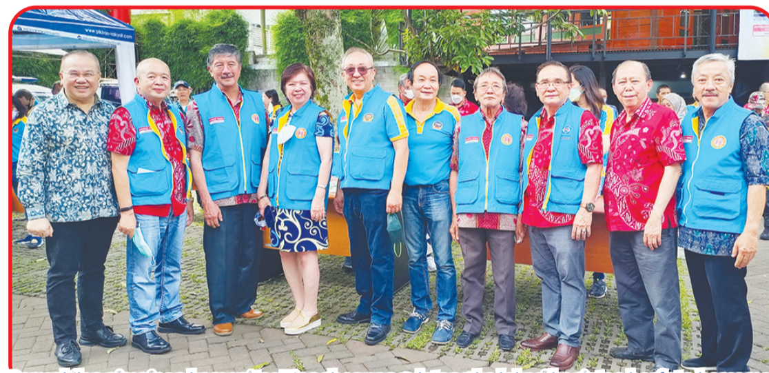
Perwakilan pimpinan komunitas Tionghoa yang datang ke lokasi kegiatan berfoto bersama.