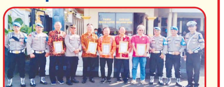
Perwakilan lima Perhimpunan Tionghoa Sukabumi berfoto bersama usai menerima piagam penghargaan.

Gunawan. Penghargaan tersebut diberikan kepada Perhimpunan INTI Cabang Kota Sukabumi ini atas partisipasi dan kolaborasi dengan pihak Polres Sukabumi Kota. "Penghargaan yang kami dapatkan ini atas kolaborasi kami dengan Polres Sukabumi Kota, baik di masa-masa pandemi maupun yang paling akhir," ungkapnya. • idn/din