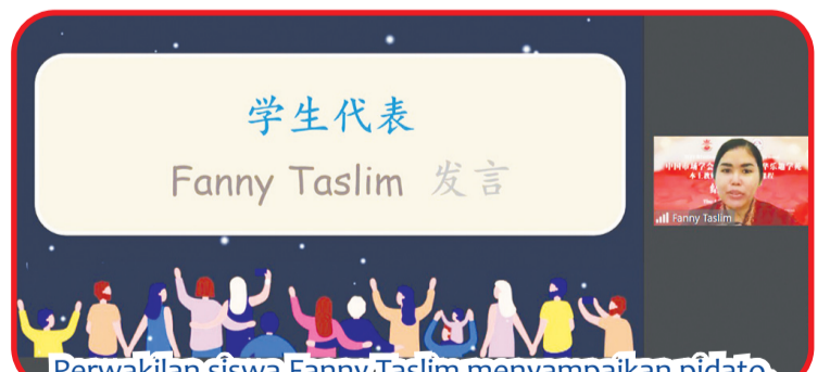
Perwakilan siswa Fanny Taslim menyampaikan pidato.