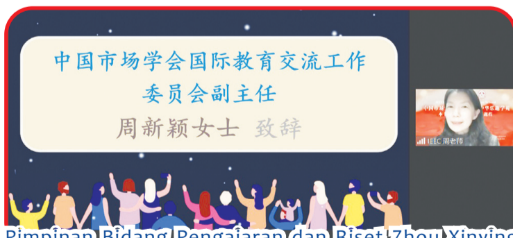
Pimpinan Bidang Pengajaran (dan Riset) Zhou Xinying menyampaikan pidato daring.