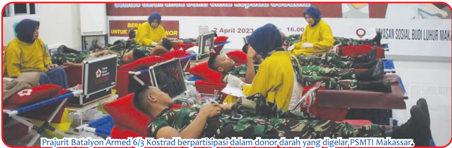
Prajurit Batalyon Armed 6/3 Kostrad berpartisipasi dalam donor darah yang digelar PSMTI Makassar.

MAKASSAR (IM) - Donor darah merupakan aktivitas yang banyak memberikan manfaat tidak hanya pada diri sendiri, namun juga kepada seluruh orang yang membutuhkan. Mendonorkan darah secara rutin terbukti memberikan manfaat baik bagi tubuh pendonor. Untuk membantu memenuhi stok darah yang dibutuhkan, prajurit Batalyon Armed 6/3 Kostrad Minggu (2/4) lalu turut berpartisipasi dalam kegiatan donor darah yang diselenggarakan PSMTI (Paguyuban Sosial Marga Tionghoa Indonesia) di Rumah Duka Budi