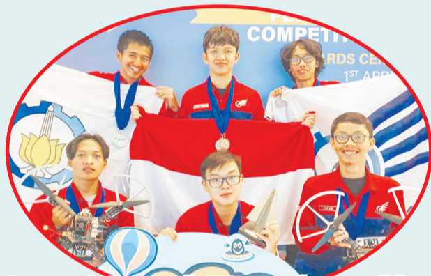
Anggota tim Bayucaraka ITS yang sukses mendulang berbagai juara dalam ajang SAFMC 2023 di Singapura.

"Kompetisi ini terbagi menjadi delapan kategori. Sementara tim Bayucaraka ITS hanya mengikuti kategori Semi-Autonomous (D1) dan Autonomous (D2)," ujarnya, Selasa (4/4). Tahun ini, tim Bayucaraka ITS mengirimkan tiga divisi Vertical Take Off and Landing (VTOL), bernama Soeromiber Team A, Soeromiber Team B, dan Soeromiber. "Melalui sinergi ketiga divisi