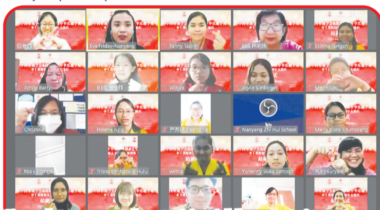
Siswa dan guru yang berpartisipasi dalam prosesi penutupan.

hadir menyampaikan pidato secara bergantian secara daring. Dalam acara tersebut, Indonesia Chinese Fun School menegaskan dedikasi tim pengajar untuk program ini. Sekaligus menyampaikan pujian dan harapan kepada para siswa. ICA mengucapkan terima kasih kepada mitra dan tim pengajar serta menyampaikan rasa cintanya kepada para siswa. Perwakilan siswa menyatakan "Terima kasih banyak kepada para guru", "Saya akan terus belajar bahasa Mandarin", "Kelak saya akan berbicara bahasa Mandarin dengan percaya diri" dan lainnya untuk mengungkapkan kecintaan mereka pada bahasa Mandarin. Puncak dari kegiatan ini adalah